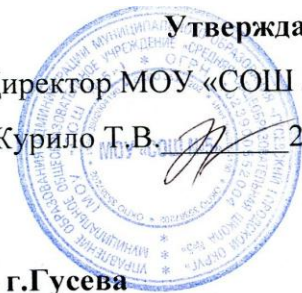
График работы ПМПк МОУ «СОШ №5» г.Гусева на 2018 – 2019 учебный год