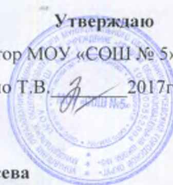
График работы ПМПк МОУ «СОШ №5» г.Гусева